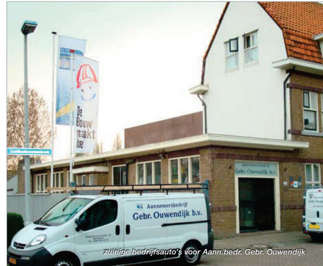
zuinige bedrijfsauto's voor Aann.bedr. Gebr. Ouwendijk

Gebr. Ouwendijk had al aandacht voor vermindering van